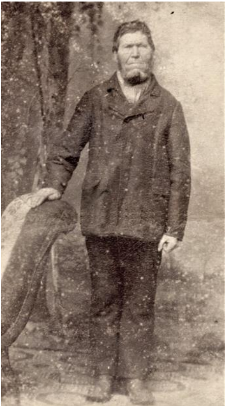
Ola Torgieson. Brukte både Bråдли og Hegelstad som etternavn. Fødd 1817 og døde i 1899.

Nye bilder legges ut fortløpende, så følg med!