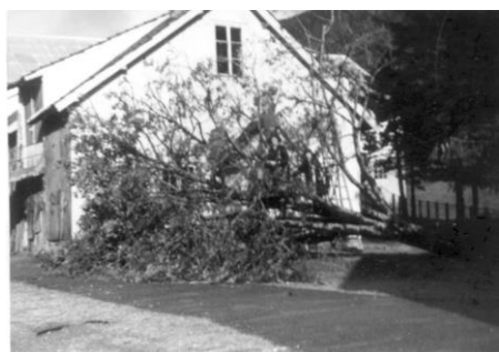
Raunen som bles ned i garden 22. september 1969 under den fæle hauststormen.