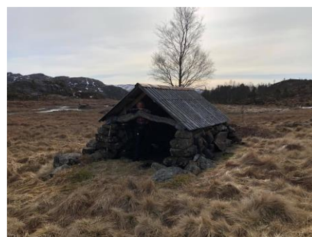
Torvløe som ligg oppå fjellet ved stien som fører til Stolen, Stolsfjellet. I buskaset bak t.h. er tufter etter en støl med hus, løe og innhegning, som siste gang ble brukt i 1860-åra. Torvløa brukt siste gang i 1934, datt ned i 1960 og bygd opp att i 1968 med asbest-tak.